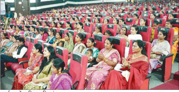
कार्यक्रम में उपस्थित महिलाएं।