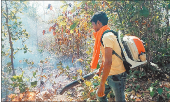
आग बुझाता वनकर्मी।

उल्लेखनीय है कि जिले के कोरबा और कटघोरा वन मंडल है। दोनों ही वन मंडल में विलुप्त प्राजाति के वन्य प्राणियों का बसरा है साथ ही इस जंगल में रामबाण औषधियों की भरमार है। मार्च का महीना शुरू हो चुका है और इसके साथ ही पारा भी चढ़ना शुरू हो चुका है। पारा चढ़ते ही जंगल में आग लगने का सिलसिला भी शुरू हो चुका है। जैसे-जैसे गर्मी तेज हो रही है जंगल में लगातार आग लगने की घटनाएं लगातार सामने आ रही है। कोरबा वन