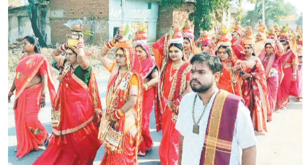
कलश यात्रा निकालती महिलाएं।

ग्राम तुमान की पावन धरा शुक्रवार को भक्ति, श्रद्धा और आध्यात्मिक उल्लास से सराबोर हो उठी, जब श्री वैष्णव निकुंज निवास में आयोजित सात दिवसीय श्रीमद्भागवत महापुराण कथा का शुभारंभ अत्यंत भव्य और दिव्य कलश यात्रा के साथ किया गया। इस अवसर पर पूरे गांव में धार्मिक उत्साह और भक्तिमय वातावरण देखने को मिला। सुबह से ही श्रद्धालुओं में कथा को लेकर विशेष उत्साह दिखाई दिया और बड़ी संख्या में महिलाएं, पुरुष, युवा एवं बच्चे इस पुण्य अवसर के साक्षी बने। कथा के शुभारंभ अवसर पर निकाली गई भव्य कलश यात्रा ने पूरे ग्राम को भक्तिमय बना दिया। पारंपरिक वेशभूषा में सजी-धजी सैकड़ों महिलाओं ने सिर पर कलश धारण कर भजन-कीर्तन और जयकारों के साथ यात्रा में भाग लिया। कलश यात्रा श्री वैष्णव निकुंज निवास से प्रारंभ होकर ग्राम के प्रमुख मार्गों से होते हुए पूरे गांव का भ्रमण करती हुई तालाब तक पहुंची, जहां वैदिक मंत्रोच्चार और धार्मिक विधि-विधान के साथ पवित्र जल का संग्रह किया गया। इसके